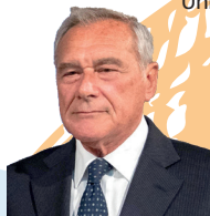
Sen. Piero Grasso